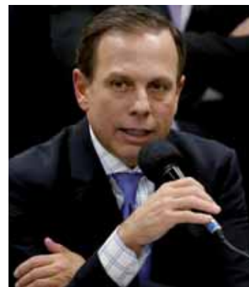
Prefeito João Doria

"Compartilho dessa corrente. Acredito na condenação e na punição do presidente Lula, mas, politicamente, o ideal seria ele ser candidato e derrotá-lo nas eleições de outubro para enterrarmos o mito Lula e aprisionarmos o Luiz Inácio", declarou. A condenação, na visão do prefeito, impõe uma "marca dura" ao ex-presidente Lula e ao PT. "Um partido já criminalizado, com seis processos, ter uma condenação de forma mais clara, terá mais dificuldade em fazer um discurso de salvação do Brasil, de éticas, de princípios e de gestão. Creio que o ex-presidente Lula vai seguir sua candidatura, vai usar dos subterfúgios que a legislatura