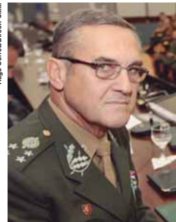
Comandante do Exército, general Eduardo Dias da Costa Villas Bôas.

O general Villas Bôas citou uma pesquisa de opinião que apontava o apoio de mais 40% da população à ideia de intervenção, e disse que tal adesão, por outro lado, reflete a confiança desses setores da