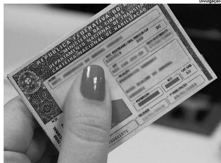
Projeto que aumenta de 65 para 70 anos a idade a partir da qual se torna obrigatória a renovação

A Câmara dos Deputados analisa o projeto que aumenta de 65 para 70 anos a idade a partir da qual se torna obrigatória a renovação a cada três anos do exame de aptidão física e mental necessário à habilitação. Apresentado pelo deputado Simão Sessim (PP-RJ), o projeto altera o Código de Trânsito Brasileiro.