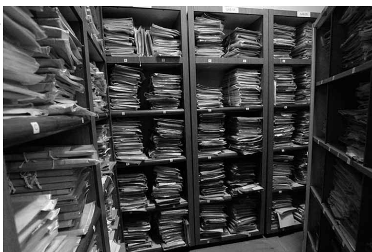
Em termos quantitativos, o tribunal com o maior número de processos sobrestados é TJ de São Paulo, com 536,2 mil.

Demandas repetitivas são processos nos quais a mesma questão de direito se reproduz de forma que sua solução pelos tribunais superiores ou tribunais locais possa ser replicada fazendo com que causas idênticas tenham a mesma solução. Além de divulgar o número dos processos com andamento suspenso por demandas repetitivas, o relatório apresenta os temas que mais geram precedentes judiciais obrigatórios. Entre esses assuntos constam questões de Direito Público, Direito Tributário, Direito Processual Civil e do Trabalho.