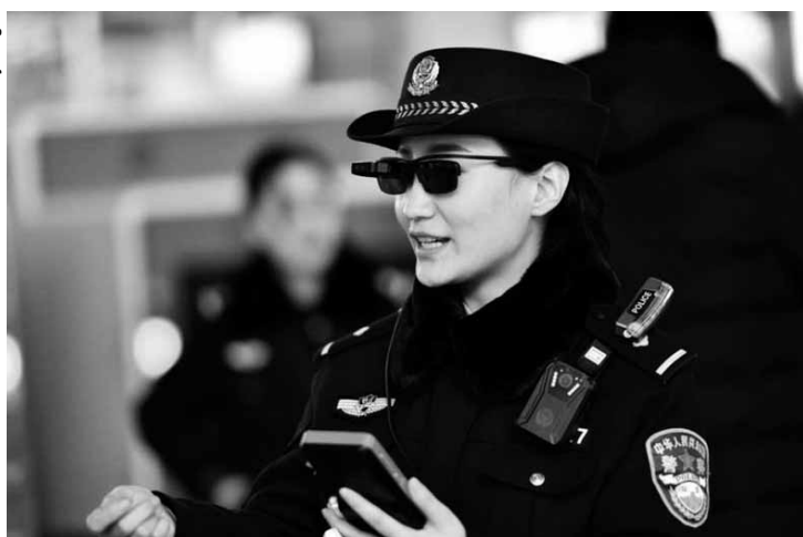
Policial tem óculos com reconhecimento facial para monitorar cidadãos.

Segundo a imprensa local, desde o dia 1º de fevereiro, os óculos especiais já ajudam a polícia chinesa a prender sete. A fase de testes foi realizada na cidade de Zhengzhou, na província de Henan. Além