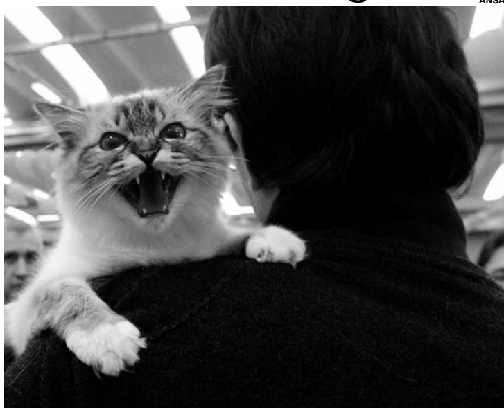
O evento começará no próximo sábado (17) e irá até 31 de março.

Após a disseminação de cafés que permitem a entrada de gatos, a Itália terá um festival dedicado exclusivamente aos felinos, batizado de “La Città dei Gatti” (“A Cidade dos Gatos”, em tradução livre). O evento terá início no próximo sábado (17), data em que se comemora o “Dia Nacional do Gato”, e irá até 31 de março. As principais atrações incluem mostras, projeções e exposições de pinturas e textos que tenham os felinos como fator comum.