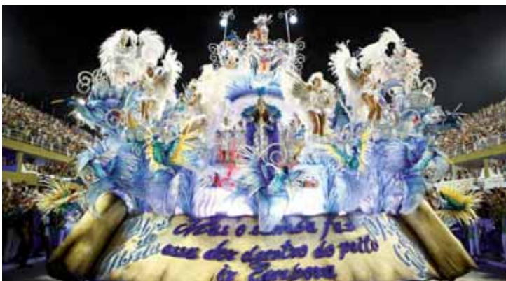
A Beija-Flor fez um desfile atípico.

Com um desfile sobre injustiças sociais, a Beija-Flor sagrou-se campeã do Grupo Especial do Carnaval do Rio de Janeiro. Em uma apuração acirradíssima, a escola de Nilópolis superou Paraíso do Tuiuti e Salgueiro por apenas um décimo.