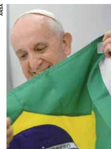
Pontífice destacou importância do perdão para os cristãos.

Segundo o líder católico, o “perdão é das ofensas a expressão mais eloquente do amor misericordioso e, para nós cristãos, é um imperativo que não podemos prescindir”. No entanto, ele reconhece que “às vezes” é “difícil perdoar” e que, é nesse momento, que todos devem perceber que o “perdão é o instrumento colocado nas nossas frágeis mãos para alcançar a serenidade do coração, a paz”. No fim do texto, o Papa invoca “a proteção de Nossa Senhora