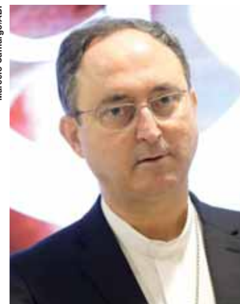
Presidente da CNBB, dom Sérgio da Rocha, na abertura da Campanha da Fraternidade 2018.

“A Igreja sempre tem alertado sobre a perda de direitos sociais. Não podemos admitir que os mais pobres arquem com sacrifícios maiores. Precisamos de políticas públicas para nos ajudar a superar e a assegurar os direitos fundamentais que as pessoas têm”, defendeu o cardeal. O presidente da CNBB listou também como prática violen-