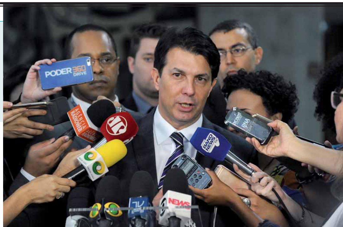
Relator da reforma da Previdência, deputado Arthur Maia (PPS-BA).

“A minha avaliação é que a gente tem que colocar em votação com a garantia de votos. A gente não pode ir pra um risco. Não é nem uma questão de governo, é uma questão do Estado brasileiro. Você impor uma derrota a uma matéria como essa não é uma derrota do governo, é uma derrota que acaba repercutindo mal para o país todo e acaba impondo sanções que talvez sejam muito graves num momento como